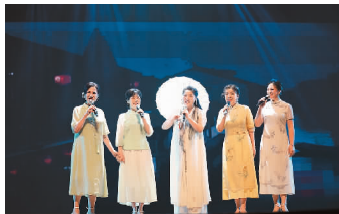
▲ “读中国·宝安诵”诗朗诵会现场

本报电（闻逸）由深圳市宝安区委宣传部主办的“读中国·宝安诵”诗朗诵会日前在宝安文化馆举办。诗人、艺术家和朗诵爱好者同台献艺，为深圳市民带来一场精彩的演出。朗诵会现场不仅有宏大主题的诗歌《读中国》《英雄》，还特别呈现三首宝安作家创作的、具有地域特色的诗歌，展现了宝安深厚的文化底蕴。现场观众表示，通过舞台朗诵呈现的精彩诗文更具感染力，让人心潮澎湃。据悉，“读中国”系列演出旨在通过诗歌这一艺术形式，表达深圳市民感恩、奋斗、奉献的精神风貌，向社会传递正能量。