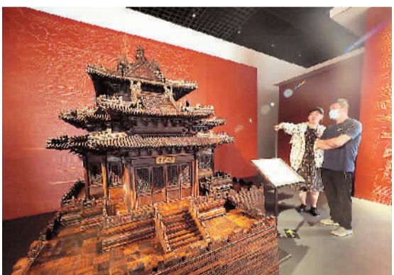
▲ 观众在参观“最美中轴线”主题展览

中国国家博物馆研究馆员、“凤鸣于溪——安溪历史文化展”策展人高秀清说，安溪背依凤山，有“凤城”之名。古时的安溪钟灵毓秀，如今，安溪在新时代取得新的发展。展览以“凤鸣于溪”为题，既是对安溪发展、腾飞的真实写照，也寓意着对安溪的美好祝福。