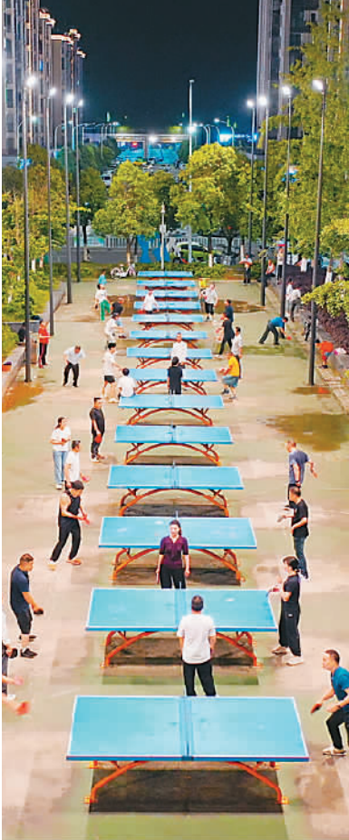
6月18日晚，重庆市梁平区全民健身中心灯火通明，市民在打乒乓球。

第三产业重点人群职业健康素养水平为48.9%。其中，医疗卫生业劳动者职业健康素养水平为65.8%，高于全国水平；快递与外卖配送业等4个行业劳动者职业健康素养水平范围为36.1%—51.7%，低于全国水平。