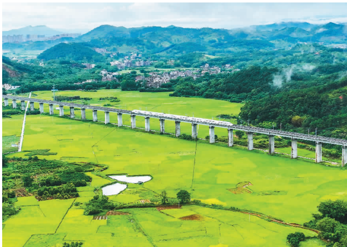
近日,广西壮族自治区梧州市龙圩区龙圩镇念村村的田地早稻泛黄,丰收在望。图为念村稻田景观。

吨,相当于再造一座“鸟巢”体育馆。电站通过500千伏输电线路接入距离50公里、装机300万千瓦的两河口水电站,实现光伏发电和水电的“打捆”送出。电站投产后年平均发电量20亿千瓦时,每年可节约标准煤超60万吨、减少二氧化碳排放超160万吨。