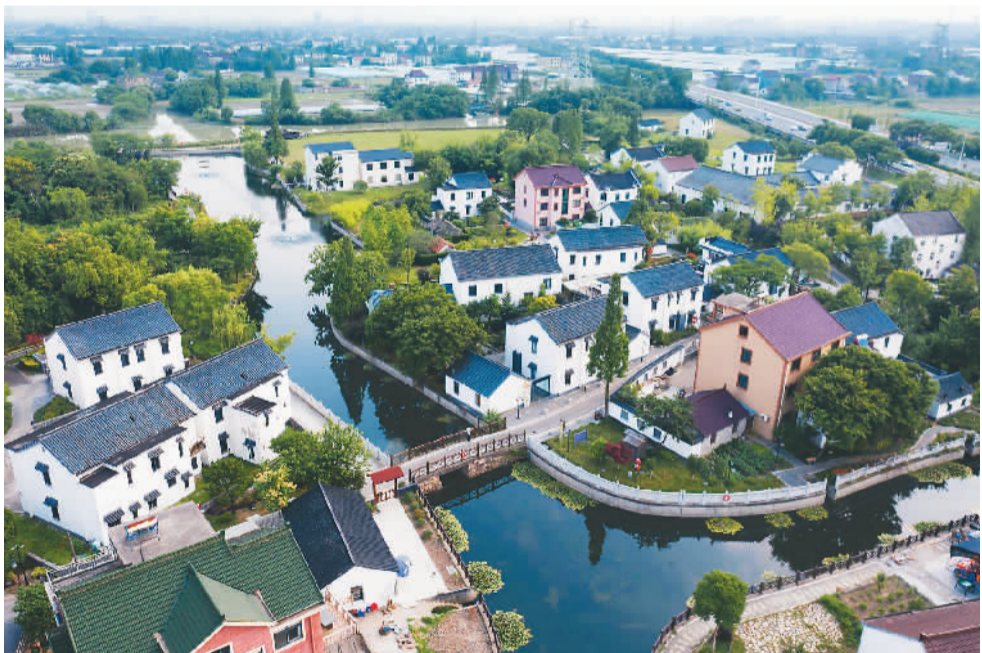
浙江省嘉兴市南湖区大桥镇胥山村景观。