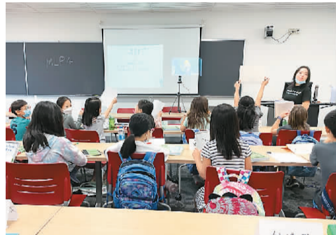
▲美国俄亥俄州现代中文学校中文班的双师课堂。