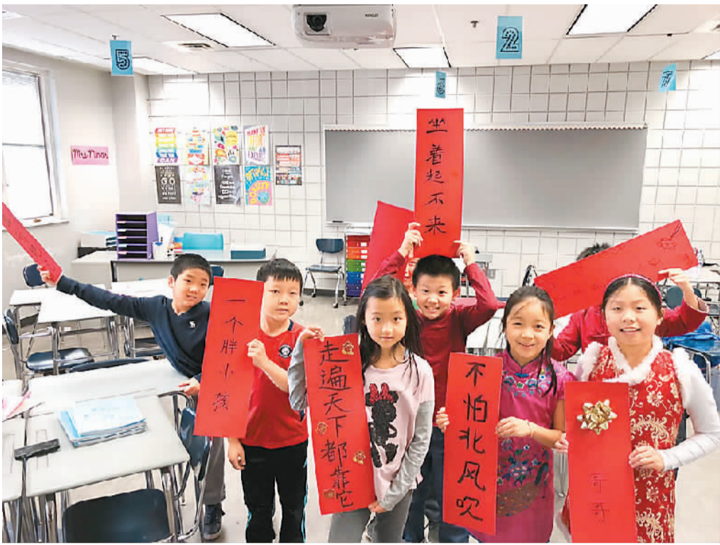
▲美国俄亥俄州现代中文学校中文班的孩子展示写好的书法习作。