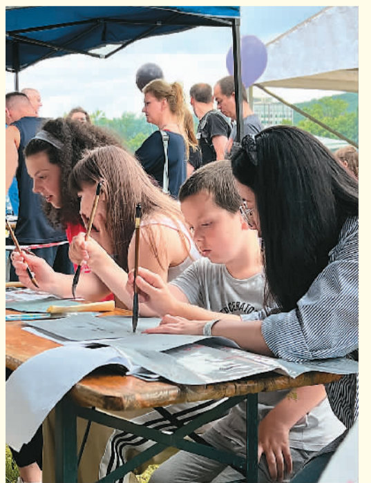
►图为匈牙利朋友在练习中国书法。

日前，匈牙利米什科尔茨大学孔子学院受邀参加当地企业举办的“家庭日”活动。活动吸引了众多中外友人参加，来自米什科尔茨大学孔院的老师们展现了书法、筷子夹豆子、踢毽子等中国特色活动，受到了匈牙利朋友的喜爱。