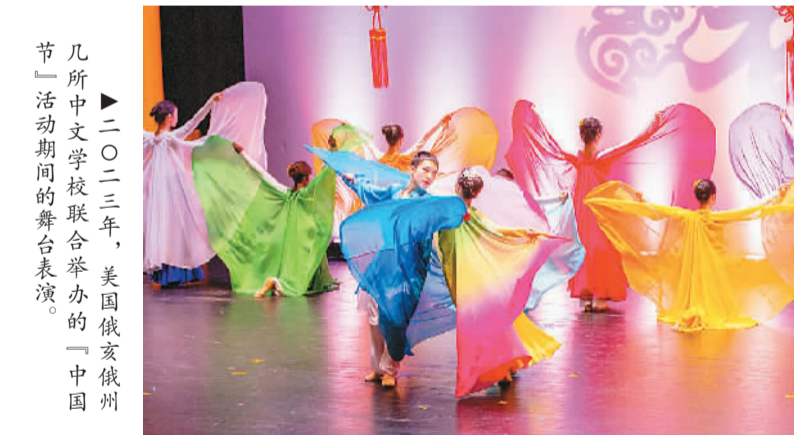
▲二〇二三年，美国俄亥俄州几所中文学校联合举办的“中国节”活动期间的舞台表演。

络感情、开展各种文体活动，推动了中文学校社区功能的发挥。由于扎根社区，中文学校在文化传承上的作用主要依靠家长齐心协力举办春节、中秋等活动，促进文化多元。而在这些活动的开展过程中，凝聚了华裔家长的情感，同时提升了自豪感。