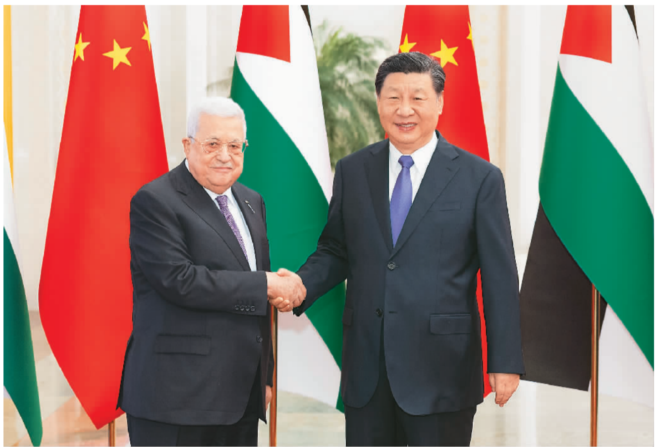
6月14日下午,国家主席习近平在北京人民大会堂同来华进行国事访问的巴勒斯坦总统阿巴斯举行会谈。这是会谈前,习近平在人民大会堂北大厅为阿巴斯举行欢迎仪式。