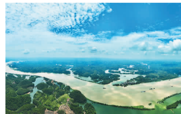
图为广西壮族自治区南宁市横州市平塘江口，平陆运河的起点。