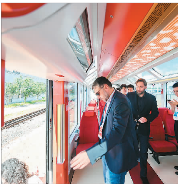
图为6月6日，参观者试乘完中国中车出口阿根廷新能源轻轨车后走下列车。

同时，如何在经济增长的基础上实现经济和社会平衡发展，不断推进改革创新和完善社会治理，是包括中国和拉美各国在内的广大发展中国家面临的重要议题。目前，拉美国家正面临治理污染、消除贫困、改善治安、实现共同富裕与社会平等等问题。除经贸合作外，中拉在治国理政方面也可以加强沟通，寻找新的合作增长点。相信中国与拉美将以共建“一带一路”为引领，不断拓展加深合作，跨越太平洋的友好合作之路将越走越宽广。 (史欣怡采访整理)