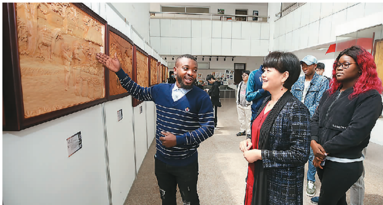
为展示刚果(布)留学生的学习成果,浙江省东阳市浙江广厦建设职业技术大学艺术设计学院举办木雕作品展,展出的作品主要分中刚友谊、非洲风土人情、人与自然和谐发展三大板块。图为刚果(布)留学生用中文为观众讲述创作思路以及作品代表的含义。

尼昂加大使高兴地表示,“中文热”在刚果(布)不断升温,中国人对刚果(布)的了解也在加深。“未来你去广州时,也许还能找到说刚果(布)语言林加拉语的中国人,这会非常有趣。刚中两国之间的民心相通非常重要,这是刚中友谊不断加深的例证。”尼昂加大使说。