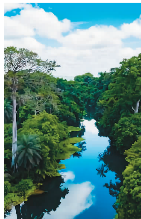
刚果(布)楚普自然保护区景色。

伊国家公园对刚果(布)经济社会发展也有积极影响。孔夸提国家公园位于刚果(布)西部沿海,不仅有森林、草原、湿地,还有美丽的海岸线。西非海牛、座头鲸、海豚、棱皮龟等是这个“半海洋公园”的特色。漫步在孔夸提国家公园的海滩上,可感受沙粒在脚趾间流动,享受海浪带来的清凉。若是乘船出海,能看到海龟在水中觅食;如果赶上鲸鱼迁徙的季节,还可近距离观看这庞大的海洋巨兽。或是在雨林中深入探险,或是在草原上静观日月星辰的变化,或是到海岸吹吹大西洋的海风,游客可以在刚果(布)尽享亲近自然的惬意,领略生态之美。