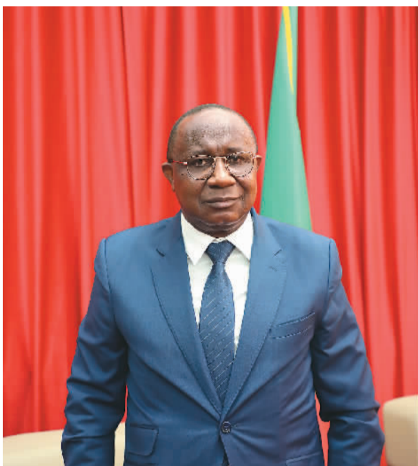
刚果(布)驻华大使雅克·尼昂加。