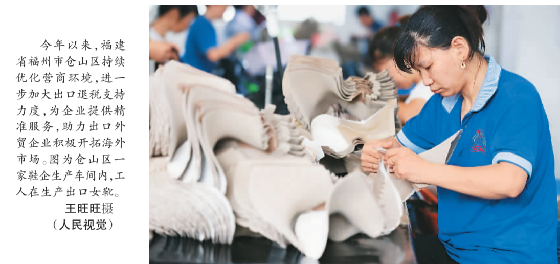
今年以来，福建省福州市仓山区持续优化营商环境，进一步加大出口退税支持力度，为企业提供精准服务，助力出口外贸企业积极开拓海外市场。图为仓山区一家鞋企生产车间内，工人在生产出口女鞋。

务二科科长沈斌表示：“光伏产品是关区的重点出口产品，这些产品出口的亮眼表现彰显了我国光伏产业技术的领先水平。我们将继续努力，帮助更多国产光伏组件走向国际市场。”