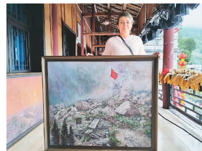
▲ 俄罗斯画家奥列格夫娜和地创作的《北川中学》