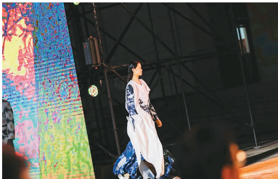
▲ 中央美术学院毕业季开幕式现场

中央美术学院毕业季开幕式以AIGC影片《Ordinary》开场，预示着人类已经站在智能文明新纪元的路口。《AI花园》单元带领观众进入到探索人工智能的时代，那里有人类与技术交织的未来。在时装秀环节，中央美术学院设计艺术学院服装与服饰设计专业的同学们围绕艺术、哲学、科技领域的前沿探索展开设计：虚