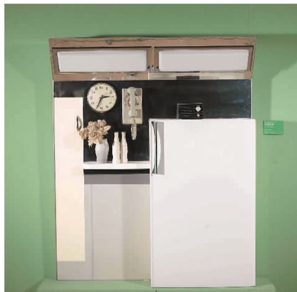
▲ 4号室内装饰（综合材料）