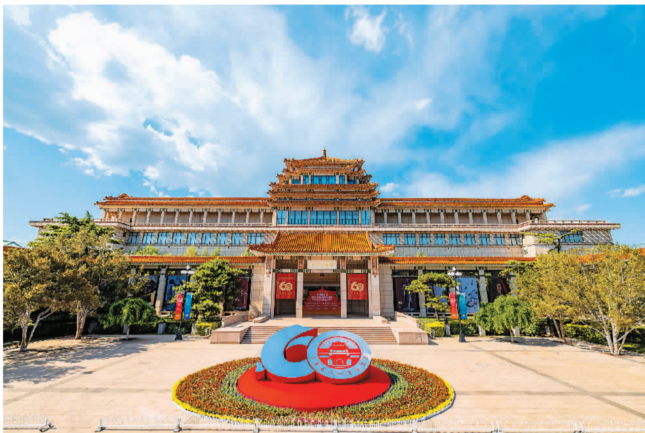
▲ 中国美术馆迎来建馆60周年

1958年开始兴建，1963年毛泽东题写“中国美术馆”馆额并正式开放。60载光阴荏苒，中国美术馆已经发展成集展览、收藏、研究、美育、国际交流、艺术品修复、文创产业于一身的艺术殿堂，见证了中国美术事业的蓬勃发展。