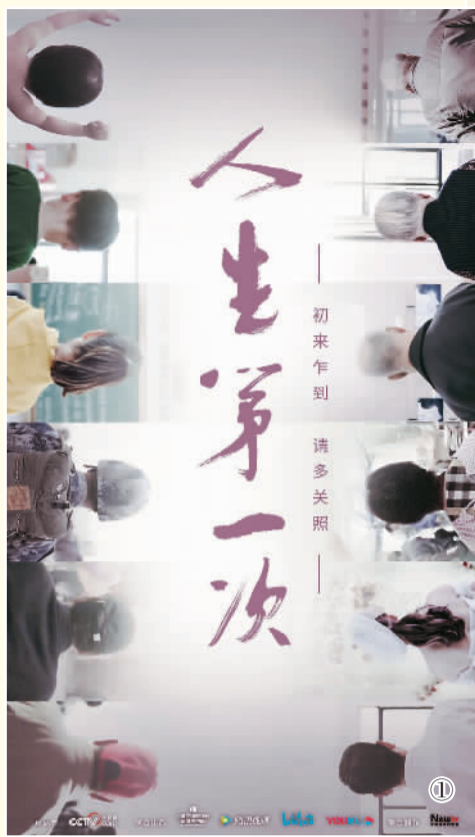
图①：《人生第一次》海报 出品方供图 图②：《山海情》海报 出品方供图 图③：《熊猫和卢塔》海报 出品方供图