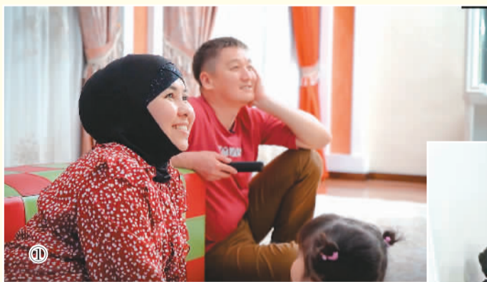
图①②：吉尔吉斯斯坦观众在收看吉尔吉斯斯坦当地电视台播出的中国影视节目

此次播映活动覆盖中亚五国9家电视台和新媒体平台。其中，乌兹别克斯坦广播公司以乌兹别克语播出纪录片《美丽乡村》《锦绣纪》。吉尔吉斯斯坦国家广播公司KT-PPK以俄语播出纪录片《美丽乡村》和《人生第一次》，吉尔吉斯斯坦莫拉斯电信DTV以俄语播出电视剧《大江大河2》。哈萨克斯坦阿拉木图电视台电视及新媒体端播出哈萨克语版电视剧《山海情》，并重播哈萨克语版电视剧《三十而已》；哈萨克斯坦One31频道早间时段重播哈萨克语版动画片《熊猫和卢塔》等。