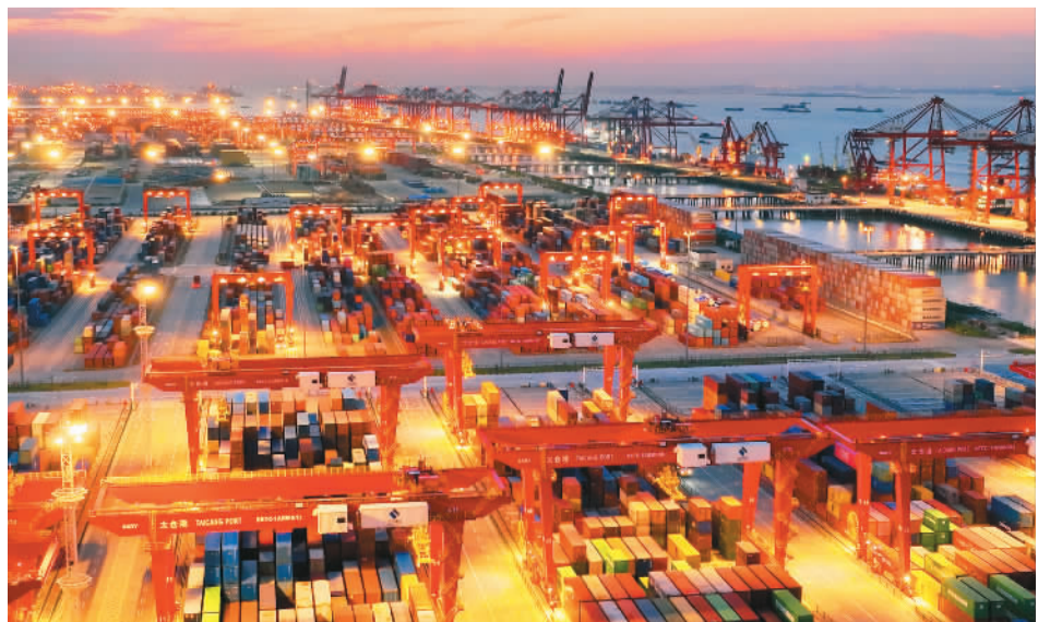
5月23日, 江苏省太仓港集装箱码头灯火通明, 码头作业运转有序。图为太仓港码头一派繁忙景象。