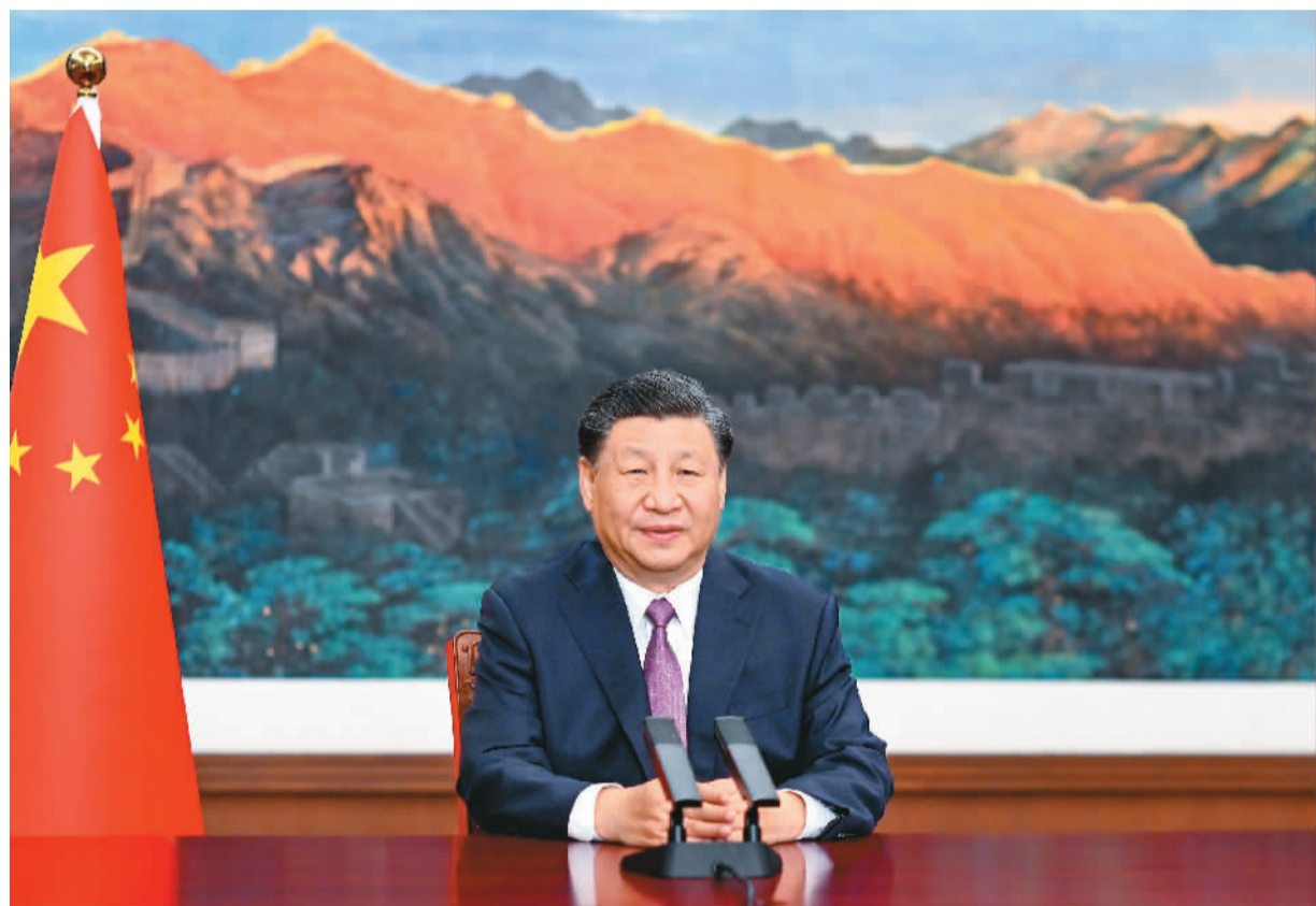
5月24日, 国家主席习近平应邀以视频方式出席欧亚经济联盟第二届欧亚经济论坛全会开幕式并致辞。

新华社北京5月24日电 5月24日, 国家主席习近平应邀以视频方式出席欧亚经济联盟第二届欧亚经济论坛全会开幕式并致辞。