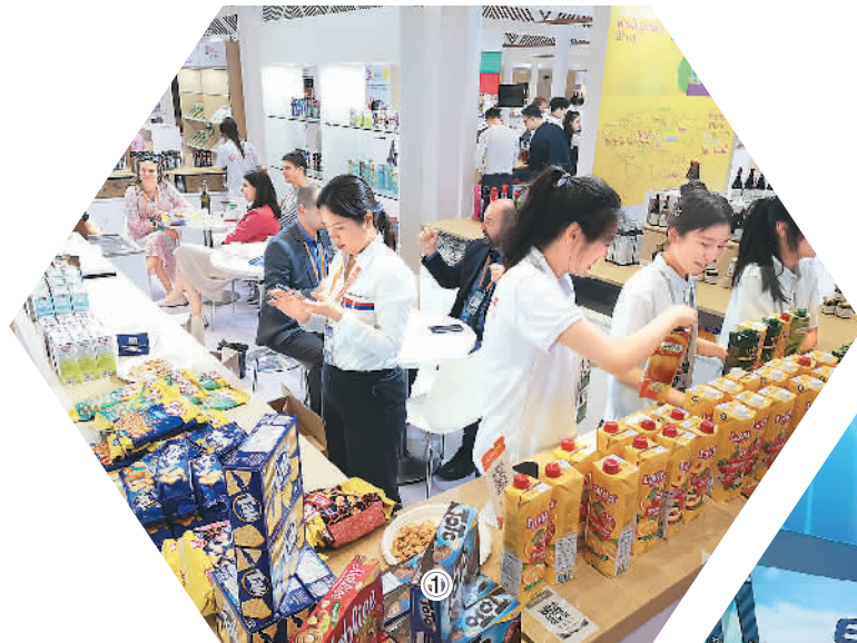
图1：在第三届中东欧博览会上，参观者品尝来自塞尔维亚等国的果汁和零食。

中东欧博览会将哪些中东欧好物摆上了中国货架？参会客商有哪些收获？本报记者进行了现场探访。