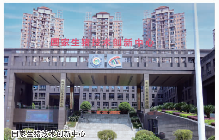
国家生猪技术创新中心

本届论坛成果丰硕，共引进四大类招商项目170个，协议投资金额突破301.01亿元。共有69个项目在招商信息发布会上集中签