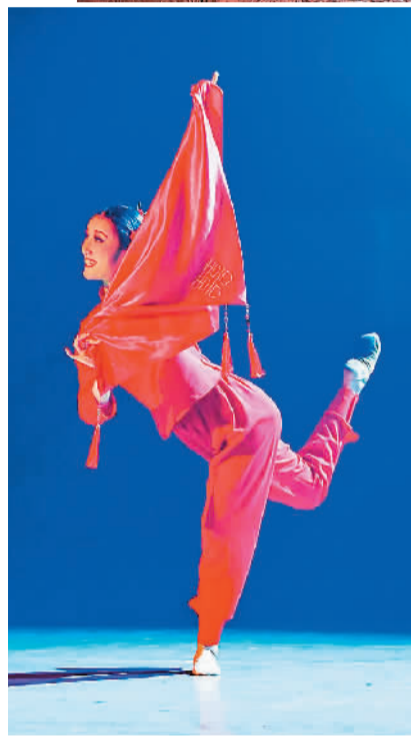
▲ 民族歌剧《同心结》剧照 ▲ 舞剧《永远的新娘》剧照