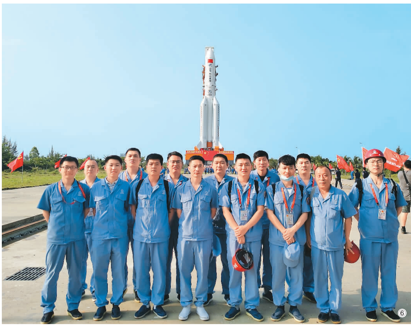
图⑥：参与长征五号B遥二运载火箭发射任务期间，工作人员在海南文昌发射场合影留念。（资料照片）