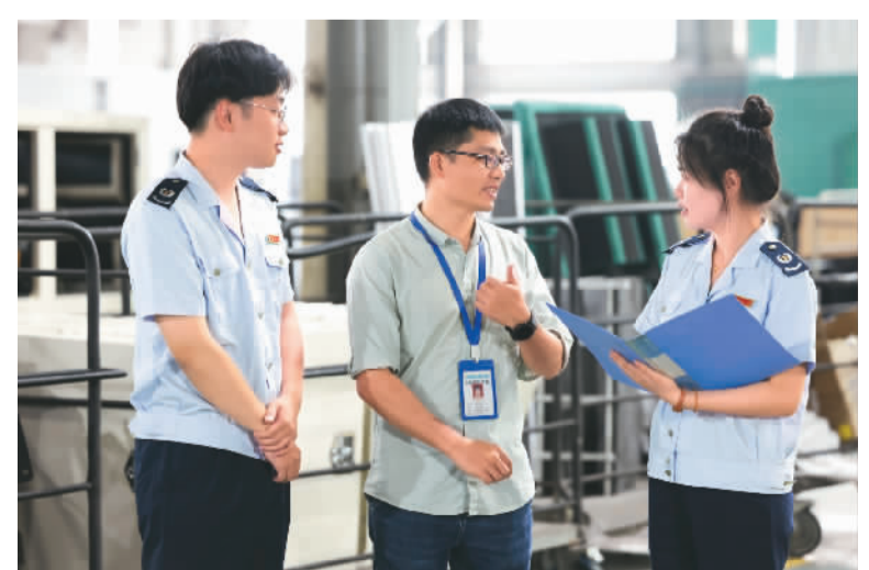
近来，国家税务总局东侨经济技术开发区税务局开展以“办好惠民服务现代化”为主题的“便民办税春风行动”，积极落实最新惠税政策，为辖区内电机企业纾困解难，助力电机企业实现高质量发展。图为该税务局工作人员在位于福建省宁德市东侨经济技术开发区的亚南电机公司为企业员工讲解最新税收优惠政策。

据了解，该峰会创办于2014年，2016年落户余姚市，是国内规模最大、最具影响力的机器人行业盛会之一，至今已吸引数万名国内外知名科学家、企业家等参加，成为国内机器人技术交流和产业发展的重要平台。本届峰会以“机器智联、赋能万物”为主题，将设置行业交流、引才引智、产业对接、专题活动、展览展示、机器人大赛等六大板块，展示机器人核心零部件、整零协作智能制造系统等新品，发布机器人行业最新技术成果。