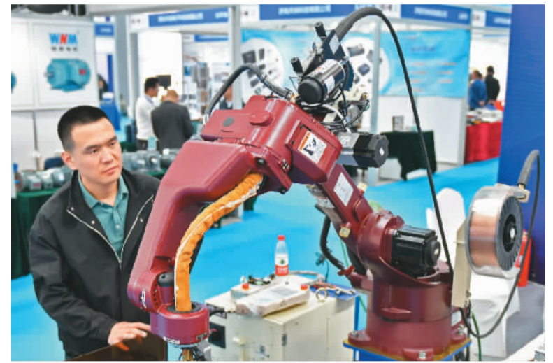
5月11日，第二十一届中国国际装备制造业博览会在山东省烟台市举行。本届博览会展览面积约2.9万平方米，设置机床工模具、智能工厂及机器人、工业自动化及传动控制等8个展区，500余家参展企业展出设备约2000台套。图为参观者在该博览会上了解一款焊接机器人。

施。一是建立去向登记制度。教育部门建立高校毕业生毕业去向登记制度，作为高校为毕业生办理离校手续的必要环节。二是明确户口迁移要求。高校毕业生户籍可以迁往就业创业地（超大城市按现有规定执行），也可以迁往入学前户籍所在地。三是明确档案转递衔接。2023年起，组织人事部门和档案管理服务机构在审核和管理人事档案时，就业报到证不再作为必需的存档材料，之前档案材料中的就业报到证应继续保存，缺失的无需补办。此外，通知还明确了报到入职流程和信息查询渠道。