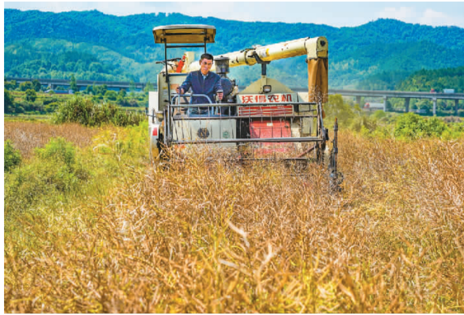
近年来，江西省抚州市广昌县积极引导农民利用稻谷收获后的农田接茬种植油菜等作物，既提高了农田的利用率，又拓宽了农民的增收渠道，为乡村振兴添“油”助力。图为广昌县头陂镇龙潭村村民正在收割油菜籽。

加快推进农村现代化——在乡村产业发展方面，着力创新更紧密的联农带农机制，促进农民就地就近就业增收，让农民更多分享产业增值收益。同时，积极探索撬动社会资本与村集体合作共赢模式，积极发展低碳农业、创意农业、智慧农业、农事体验、农旅融合，促进乡村产业深度融合发展。