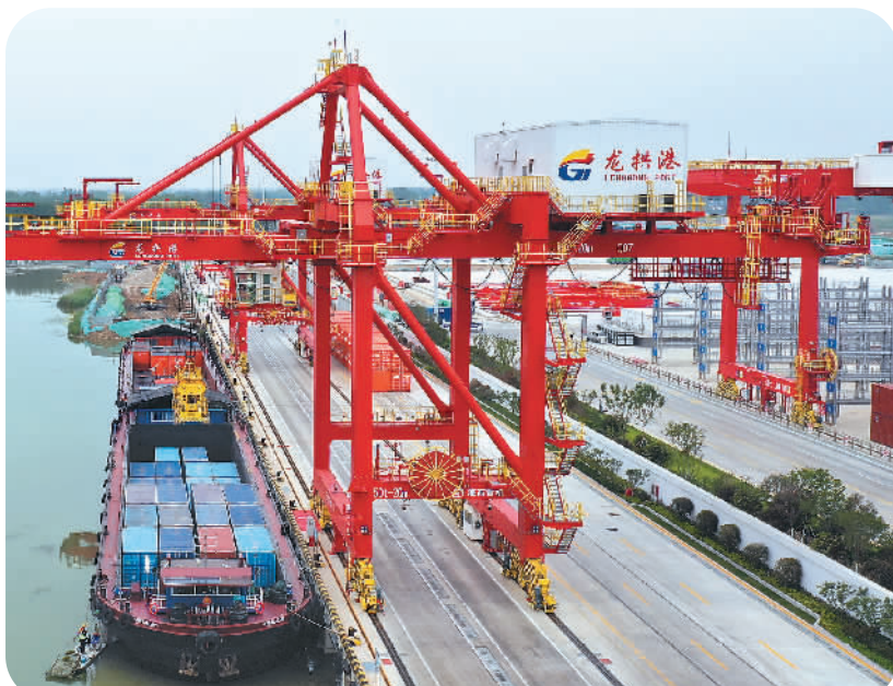
近年来,山东省济宁市依托京杭大运河的区位优势,开启内河运输绿色化、智能化集装箱运输的新模式。图为5月10日,山东济宁港航龙拱港,智能化码头正在进行卸载作业。

“中东是中东人民的,中东地区事务应由中东人民自主决定。”汪文斌说,叙利亚重返阿盟,符合阿拉伯国家人民意愿,有助于阿拉伯国家加强团结自强,也有利于促进中东地区和平稳定。美方应该尊重中东国家人民意愿,停止搞胁迫外交,停止破坏中东国家对话和解进程,停止通过制造矛盾企图分裂中东。