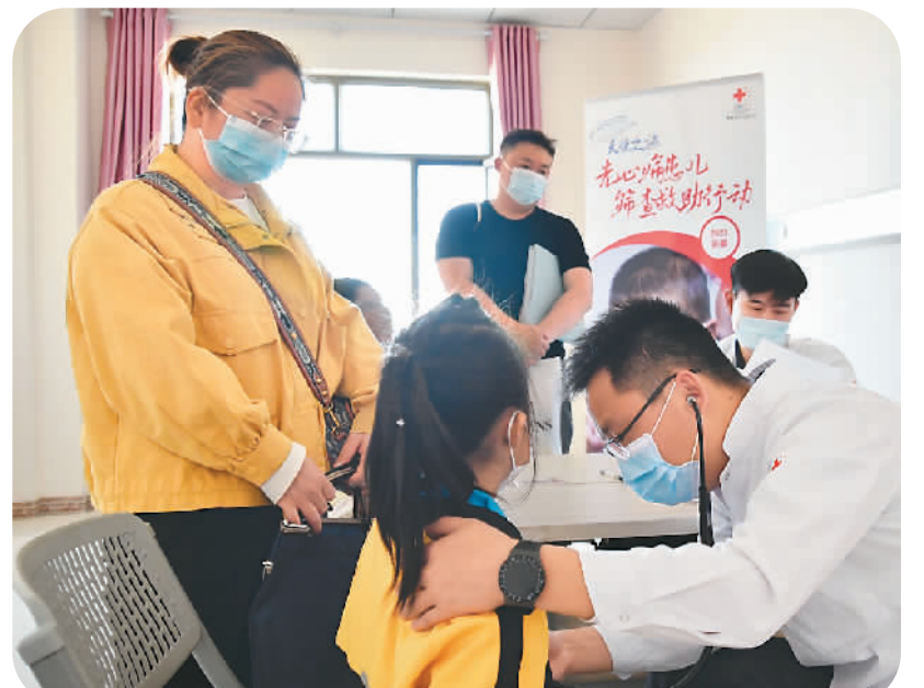
5月10日,由中国红十字会组织的上海德达医院和无锡明慈心血管病医院两组医疗团队,前往新疆维吾尔自治区伊犁哈萨克自治州开展先天性心脏病患儿筛查救助行动。图为来自无锡的专家正在进行诊断。