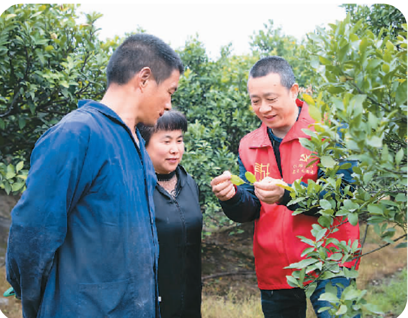
浙江省台州市黄岩区积极组织党员干部深入田间地头,通过宣传政策、指导农技、参与春耕等方式,为“三农”服务。图为日前黄岩区东城街道党员在农业园为群众推广绿色防控技术。