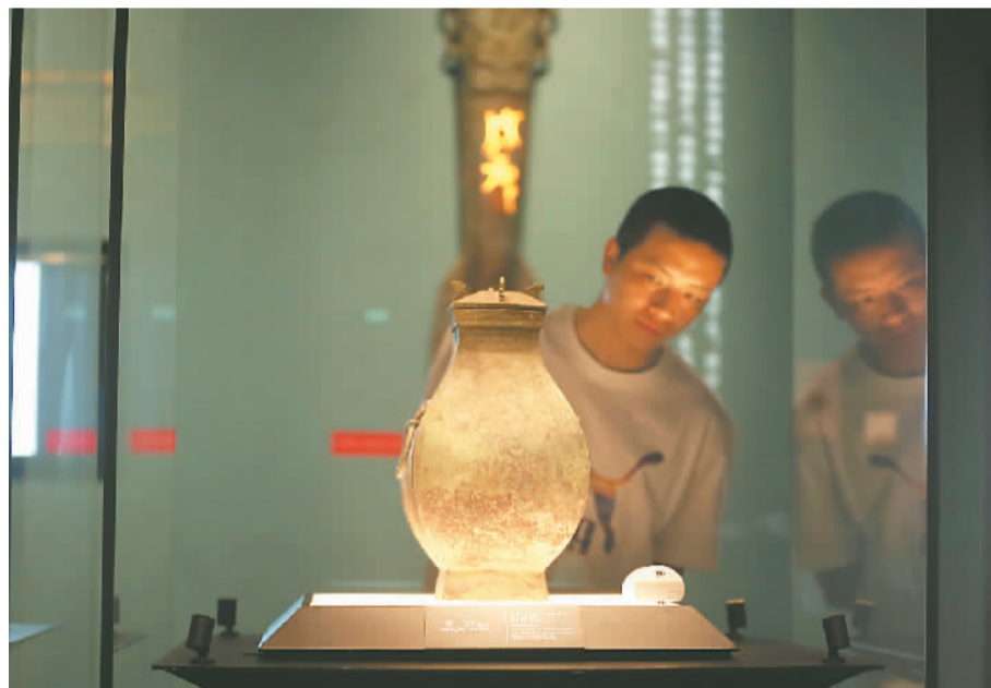
博物馆是展示一座城市历史文化、人文底蕴的“会客厅”。图为游客在四川省成都市四川博物院参观。

“五一”假期，江西南昌滕王阁景区上线《滕王阁序》VR自助背诵评分平台，虚拟数字人化身唐代诗人王勃，担任“考官”为游客评分，评分达标的游客即可免费游览。这一活动吸引许多游客前往挑战。滕王阁管理处综合管理部副主任毛琦介绍，滕王阁景区在常态化开展背诵《滕王阁序》免门票活动的基础上升级了背诵方式，在保留传统文化内涵的同时，注入更多现代科技元素，给游客带来便利和乐趣。