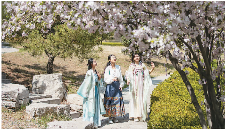
山东省广饶县孙子文化旅游区里，以“梦回春秋·最美花朝”为主题的汉服花朝节吸引游客身着汉服“打卡”旅游。