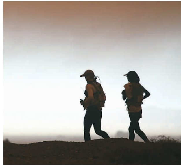
下图：参赛选手在比赛中。

作为一项从赛制、赛规到赛事运营全部原创的民族体育IP赛事。本届玄奘之路戈壁挑战赛助力体育赛事融合文化遗产。比赛同期举办了玄奘文化论坛、讲座、推介等一系列活动，实践“体育+”促进文化传播、社会发展、地方经济的新探索。10余年来，玄奘之路系列活动在瓜州县直接带动消费4.66亿元，解决地方就业9.8万人次，综合拉动地方消费逾10亿元。