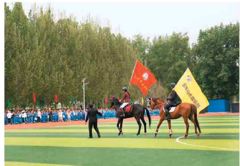
金盾马术俱乐部在河北省三河市第五中学校园文化体育节开幕式上进行马术表演。 资料照片

对此，业内人士表示，马术俱乐部需要与马术行业协会、马术俱乐部、行业机构进行精准匹配，面向市场输送现代化马术应用技能型人才。同时，应探索人才培养新模式，让马术专业人才的规模不断壮大。