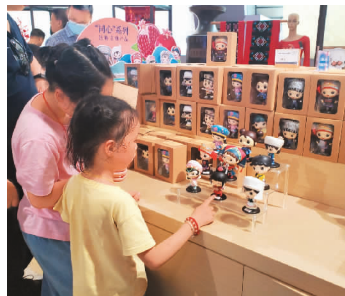
下图：广西民族博物馆内，孩子们在挑选文创产品。

“五一”期间，文化和旅游融合特征更加明显。文博看展、文化演艺、国风潮热成为旅游新风尚，“旅行+演艺”“旅行+看展”“旅行+副博物馆”受到市场青睐，各地相继推出看展式社交、国风汉服、围炉煮茶、音乐雅集等活动，演唱会、音乐节所在地周边的酒店预订量同比升高，旅游在周边消费场景的溢出效应愈发明显。中国国家博物馆、甘肃敦煌博物院等文化地标热度不减。山东烟台迷笛音乐节、北京草莓音乐节门票基本售罄。云南丽江举办简单假日生活节，打造“音乐+文旅+生活方式”的全新范本。四川三星堆考古研学、川剧变脸非遗研学、山东青岛海洋军事展览馆爱国主义研学、天津海洋博物馆科普研学、浙江西溪湿地农业研学等项目丰富多彩。