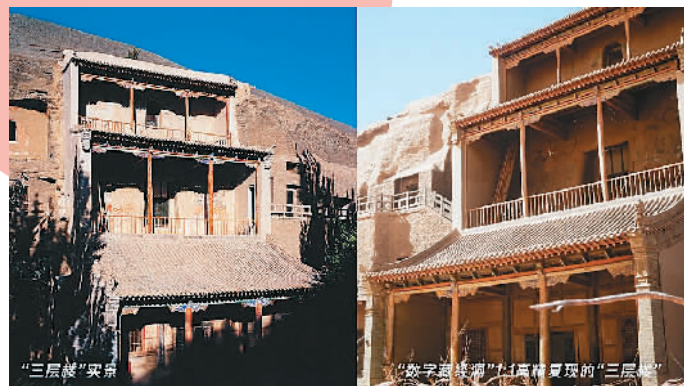
▲现实中莫高窟“三层楼”和数字世界的“三层楼”对比。

子、集)、道经、摩尼教典籍、景教典籍、俗文学、文书档案等。官私文书是其中最具史料价值的部分，均为当时的第一手资料。此外，还有大量古藏文、回鹘文、于阗文、粟特文、梵文等各种文字写成的文献材料，丰富了少数民族生活和中西交流的历史记录。