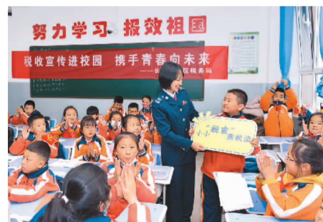
国家税务总局山西省长治市潞州区税务局近日开展“税收宣传进校园”主题教育活动，培养青少年依法纳税意识。图为税务工作人员在长治市潞州中学（北校区）开展税法小课堂。

鲁班工坊是天津职业教育首创并率先组织实施的国际合作项目，是将中国的教学模式、专业标准、技术装备、教学资源与世界伙伴分享的实体化平台，为合作国家培养认知中国产品、了解中国工艺、熟悉中国技术的本土化人才搭建了促进世界产教融合、服务国际产能合作的公共平台。截至目前，天津已在亚非欧三大洲20个国家成功设立了21个鲁班工坊，成为中国职业教育的国际品牌。