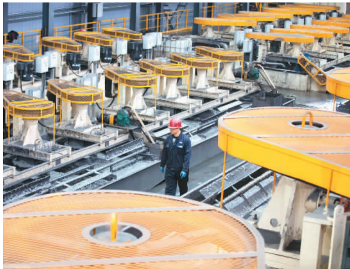
日前,工人在黑龙江鸡西哈工高碳石墨材料有限公司生产车间工作。