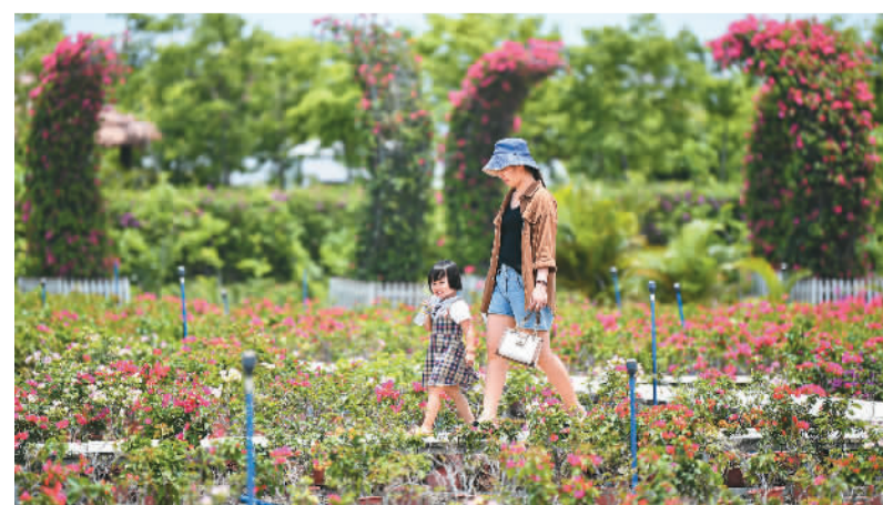
海南花梨谷文化旅游区位于海南省东方市,占地1.2万亩,种有100余万棵黄梨树。图为游客在旅游区游玩。