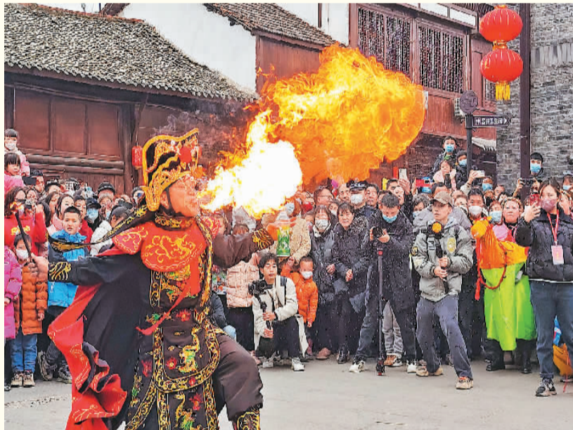
▲ 市民在四川省宜宾市翠屏区李庄古镇拍照。