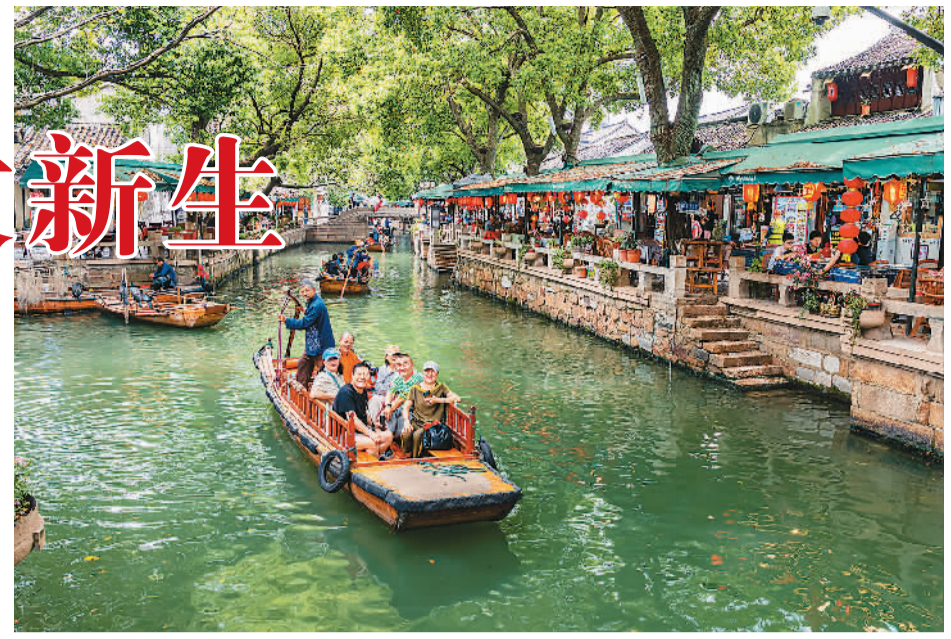
游客在江苏省苏州市吴江区的同里古镇游玩。

事实上，每个古镇历经岁月洗礼，都有独特的人文内涵、美学特质。受访专家表示，要认真梳理历史源流，充分挖掘每个古镇独特的文化符号，并做好商业化与文化保护传承之间的平衡。唯有如此，古镇发展之路才能越走越宽。