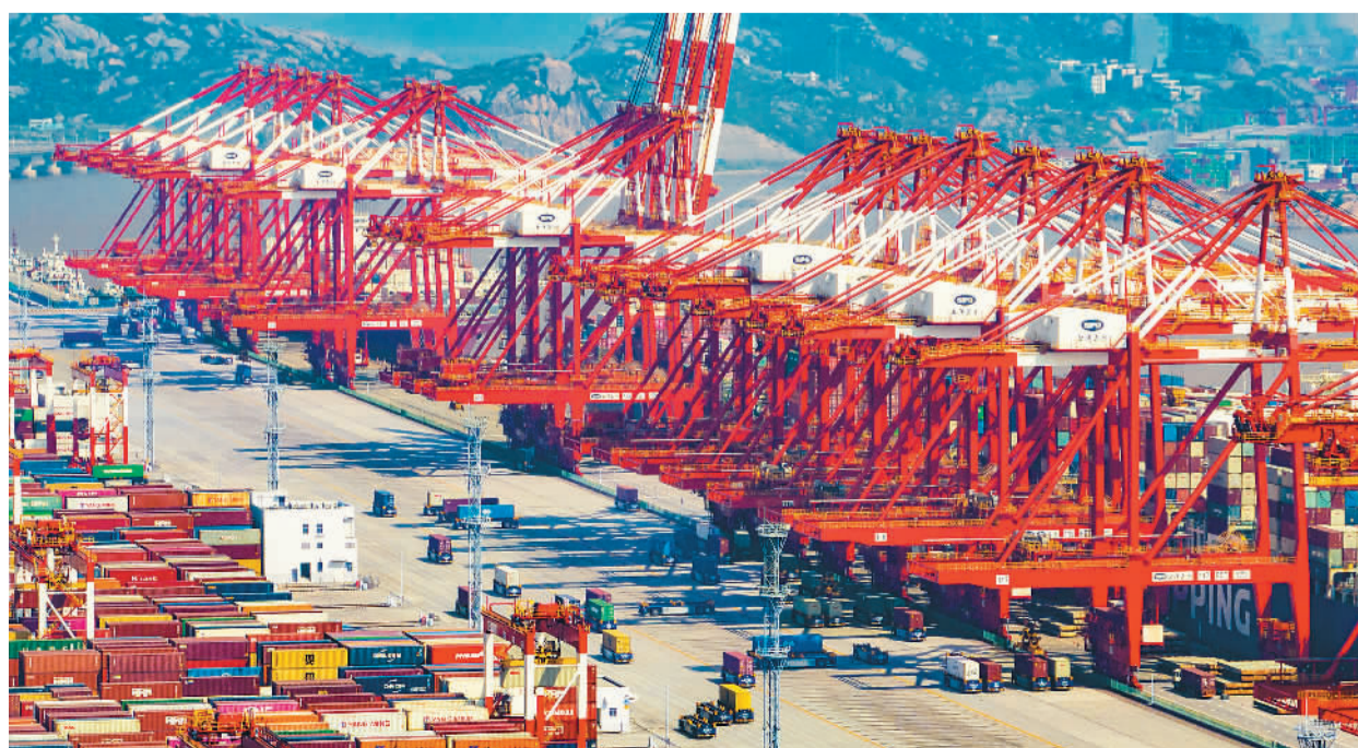
今年以来,上海港通过提升港口货物装卸转运效率、扩大海铁联运箱量等举措,确保港口吞吐量稳步增长。图为4月27日,上海港洋山深水港区自动化码头作业繁忙有序。

列车采用中国标准为雅万高铁量身定制,最高运营时速350公里,4动4拖8辆编组,依托复兴号中国标准动车组先进成熟技术,适应印尼当地运行环境和线路条件,融合印尼本土文化,进行适应性改进,具有技术先进、安全智能、环境适应力强、本土特色鲜明等特点,满足雅万高铁运营需求。