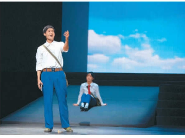
音乐剧《风花雪月》剧照。

据悉，该剧由甘肃省歌剧院、北京璀璨聚星文化集团有限公司、甘肃绝色敦煌之夜文化有限公司联合出品，是国家艺术基金2022年度舞台艺术创作资助项目。