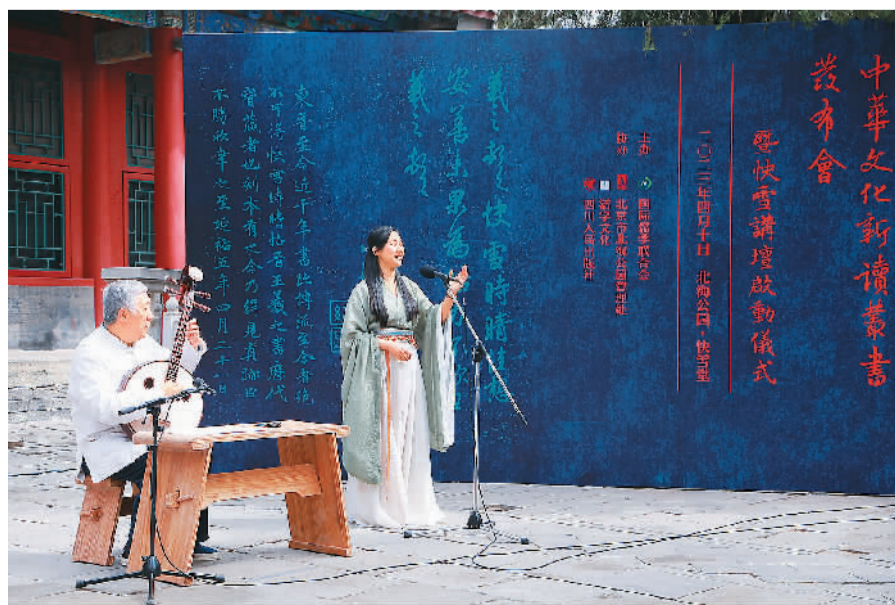
“中华文化新读”丛书发布会暨“快雪讲坛”启动仪式活动现场。