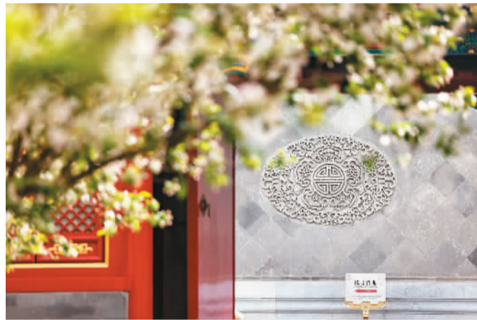
恭王府博物馆“海棠雅集”活动现场。

恭王府博物馆还将与国内、外具有王府遗址基础的文化机构“加好友”，成立联盟组织，以加强和优化此类文化遗产的保护、管理、利用为核心，开展经常性、长期性的交流与合作。