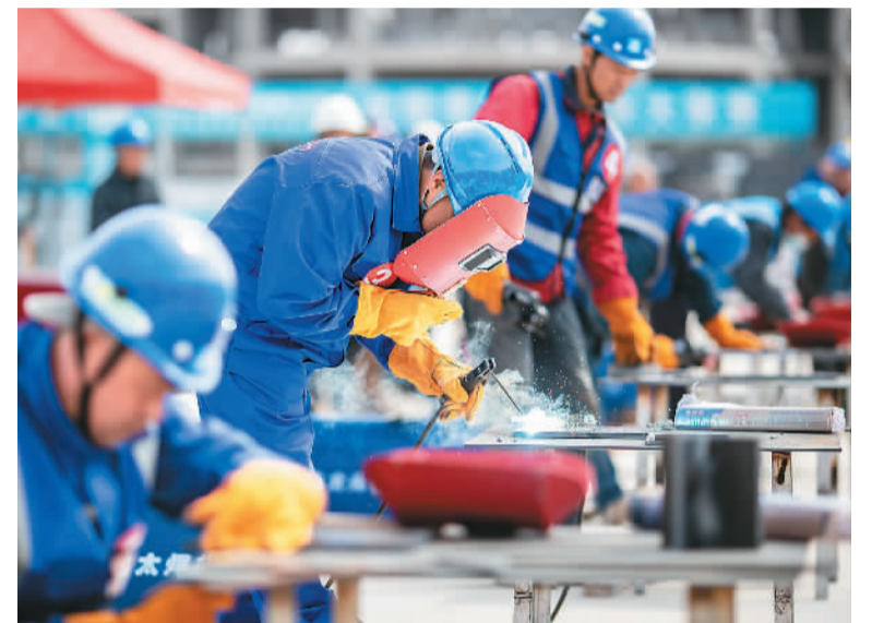
4月24日，在中建三局内蒙古警察职业学院新校区建设工地，第四届内蒙古呼和浩特市“工匠杯”建筑行业职业技能竞赛开赛。建筑工人们通过职业技能比拼，迎接“五一”劳动节到来。图为选手在参加电焊项目比赛。

据介绍，经过多年探索，我国已初步明确了车路云一体化的路径，智慧公路体系架构日益清晰，发展理念、云内涵不断丰富，产业生态加速构建，推动行业形成共识，为凝聚发展合力提供了重要支撑。