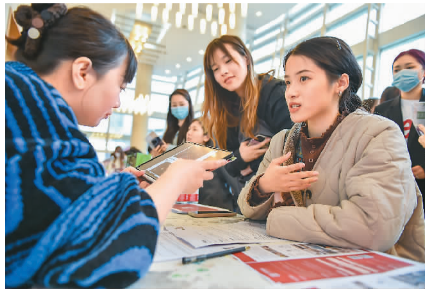
4月23日，江苏南京艺术学院举行2023年春季毕业生校园招聘活动，150余家用人单位提供约470个招聘岗位，吸引众多应届毕业生前来应聘。图为该校学生在招聘会上与企业招聘人员进行交流。

人社部职业能力建设司副司长王瑞君介绍，去年以来，人社部进一步健全终身培训制度，落实“十四五”职业技能培训规划，聚焦重点群体和重