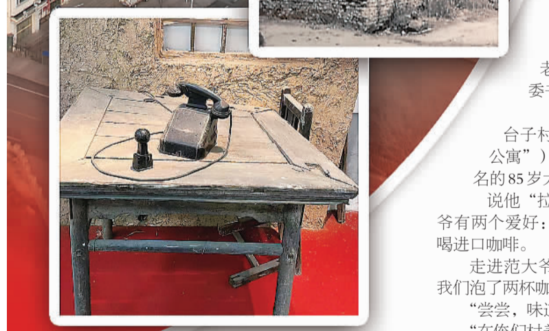
▲周台子村村史馆陈列的37年前村部的全部家当——一张桌子、一把椅子、一部电话。