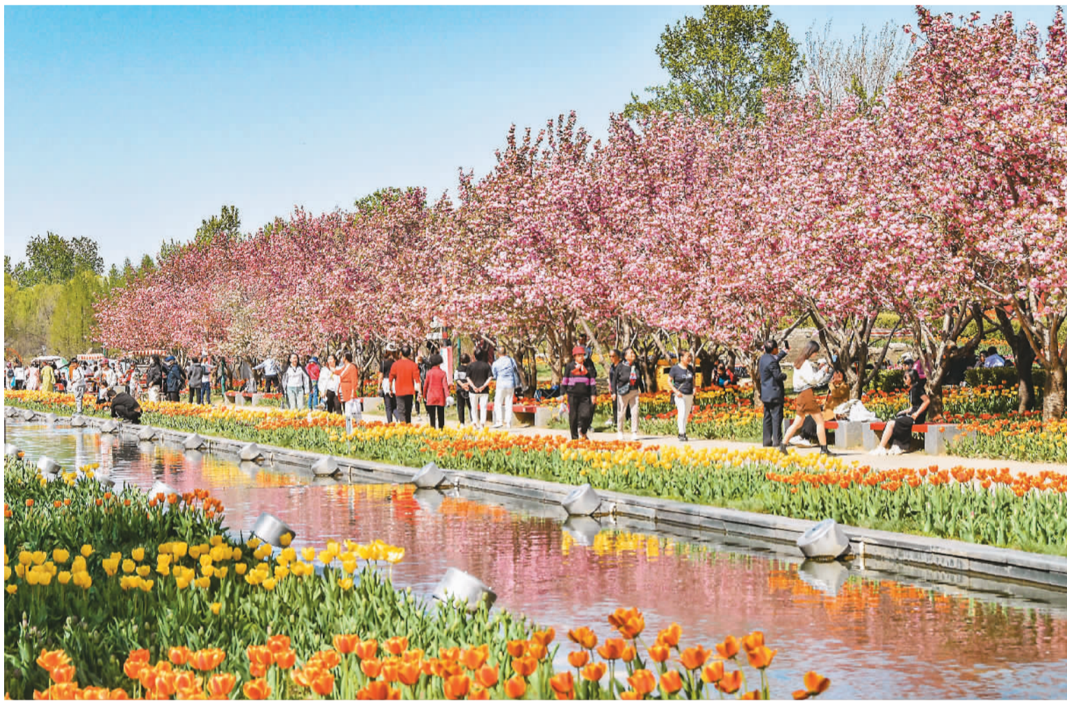
位于顺义区的北京国际鲜花港内，樱花树整齐排列，朵朵樱花在蓝天下随风舞动，形成一道亮丽风景线。图为日前游客在北京国际鲜花港游览。