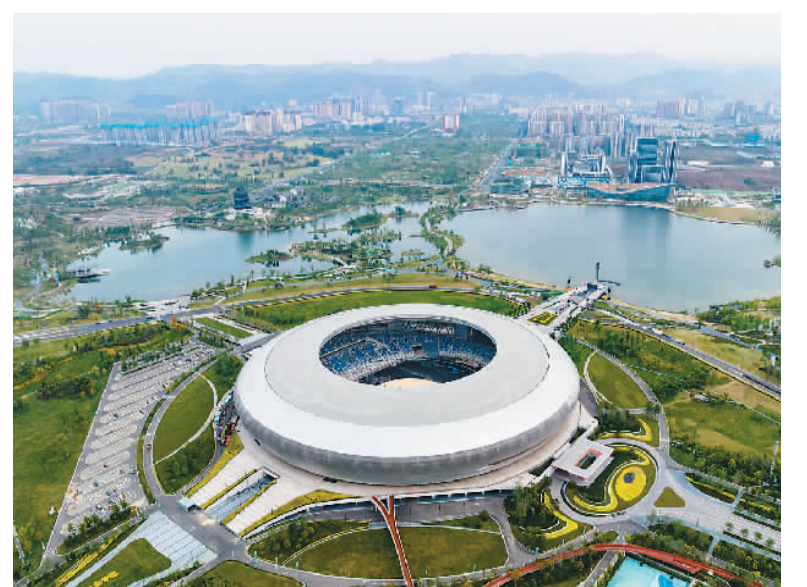
成都大运会开幕式举办场地东安湖体育公园主体育场。

“正如联合国秘书长发言人指出，此类行为不符合美国按照《联合国宪章》和《联合国特权及豁免公约》应承担的义务。美国应当给国际社会特别是联合国一个交代，以实际行动切实履行东道国应当承担的责任和义务。”汪文斌说。