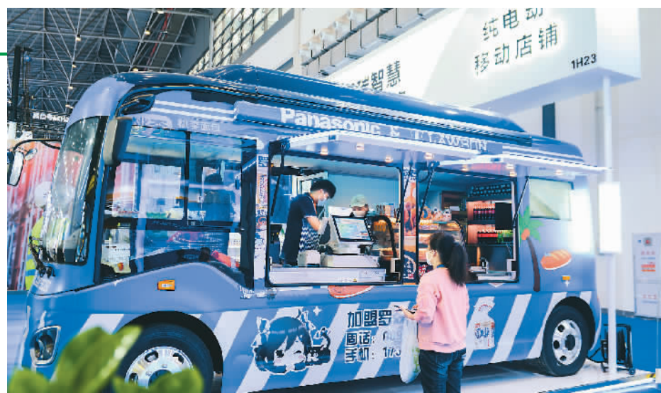
图为消博会上展出的纯电动移动便利店。

近年来，中国充分挖掘绿色低碳科技创新潜力，在实现传统产业绿色转型的同时，培育壮大新兴产业，不断拓展绿色发展“新赛道”。外媒注意到，绿色已成为中国高质量发展的底色。