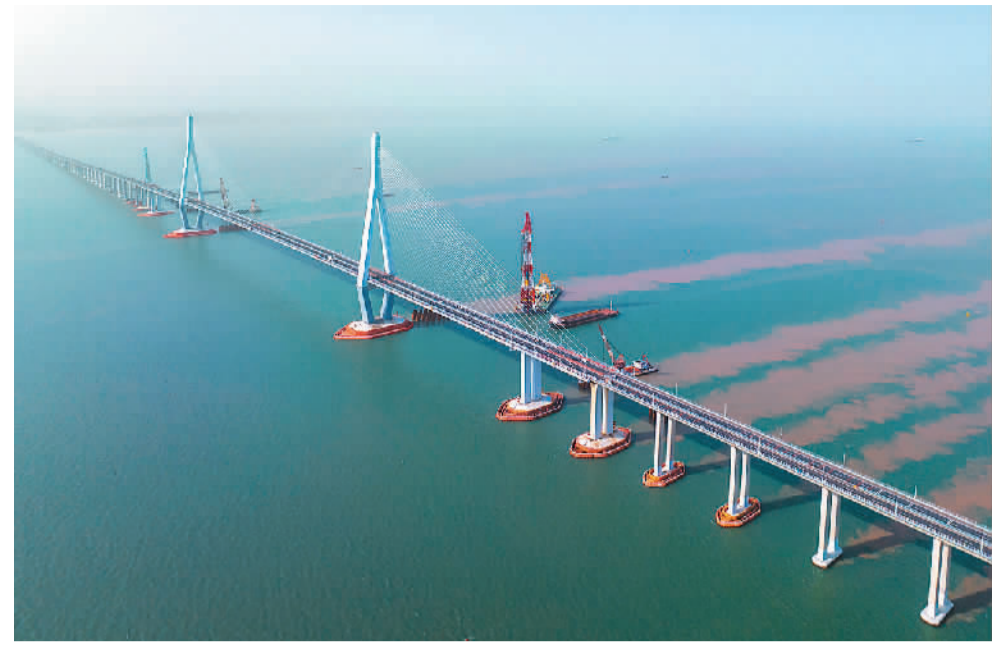
浙江宁波至象山（鄞）铁路工程象山港跨海大桥项目鄞州段日前开始海上作业，标志着国内首座市域（郊）铁路跨海大桥全线开工，施工按下“加速键”。