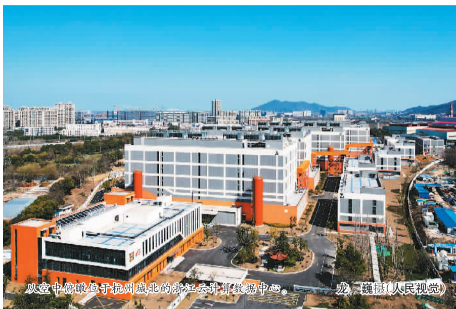
从空中俯瞰位于杭州城北的浙江云计算数据中心。

云计算是推动数字经济与实体经济深度融合的催化剂。近年来，中国云计算产业年增速超过30%，是全球增速最快的市场之一。从互联网行业延伸到传统行业，云计算正成为赋能数字经济的创新平台和基础设施。 在数字经济时代，云计算将如何推动数实融合、助推创新发展？