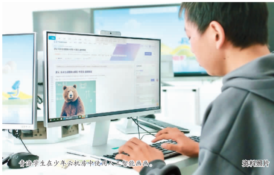
青海学生在少年云机房中使用人工智能画画。 资料照片