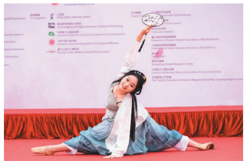
香港第十二届“国际华服节”暨第十四届“夫子庙会”近日在尖沙咀文化中心露天广场开幕，十几个团体为观众带来华服巡游、各民族歌舞等各式各样的表演。图为演员身穿传统服饰进行歌舞表演。

自2018年开办以来，扬州·台湾文创设计大赛已成功举办五届，累计有约3000件两岸作品参赛。沈春池文教基金会表示，将持续为弘扬中华文化艺术、深耕两岸文艺交流而努力。