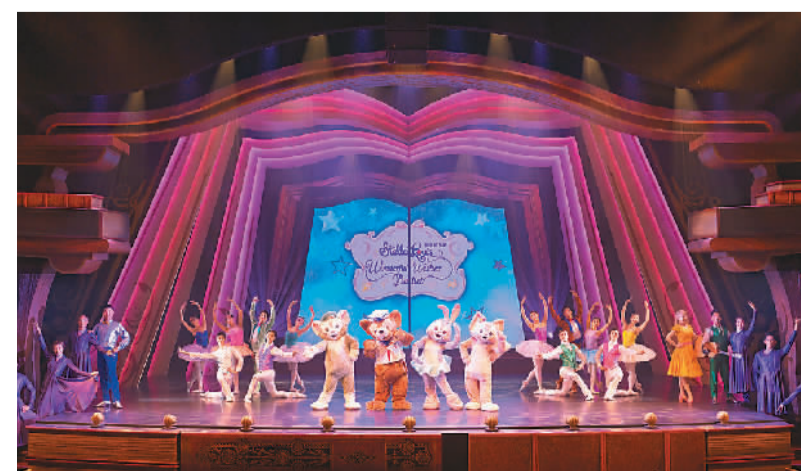
“星黛露梦想起舞吧”芭蕾舞首演现场。

据介绍，该表演还将于4月14日至16日期间上演，每日会有4至5场演出，每场演出时长约30分钟。