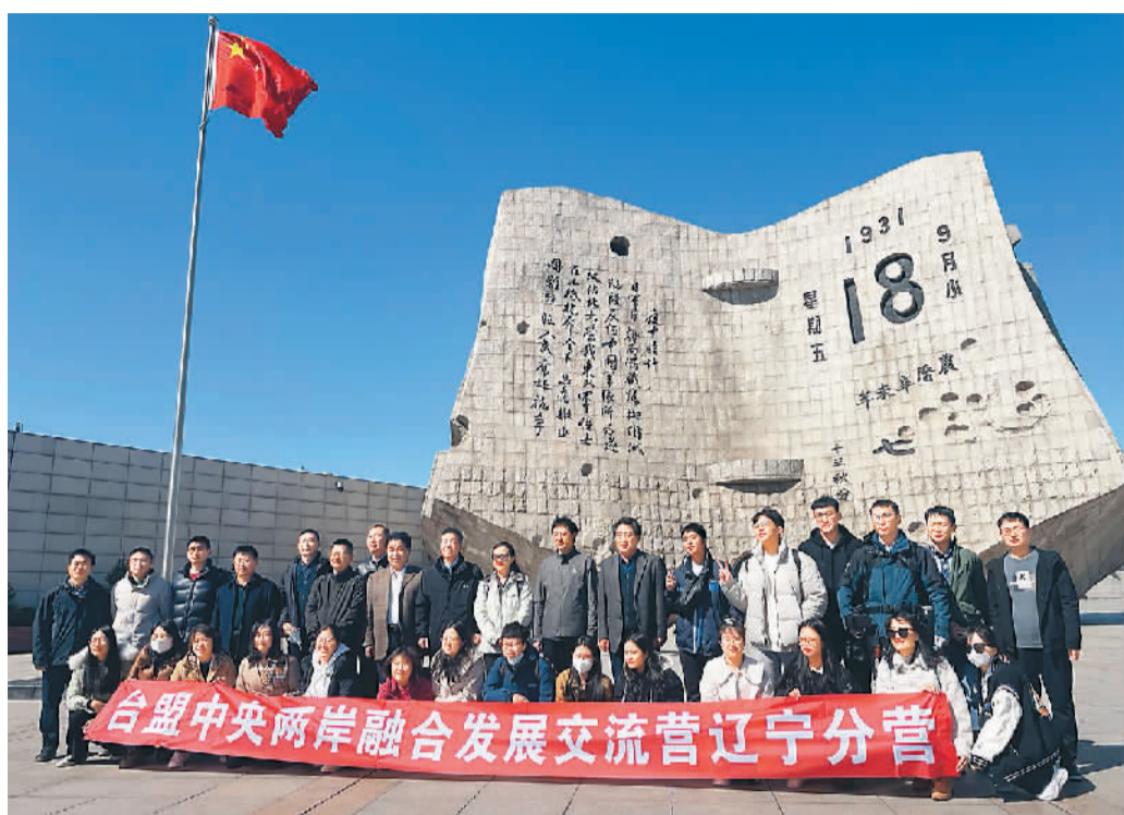
两岸融合发展交流营辽宁分营营员在沈阳“九一八”历史博物馆广场上合影。

由台盟中央主办，台盟辽宁、吉林省委会承办的两岸融合发展交流营辽宁分营4月6日至9日举办。4天时间里，10余名来自全国多所高校的台湾学生展开了一段穿越5000年时光的历史文化之旅。