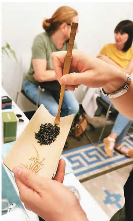
西班牙格大孔院中国茶艺课堂。