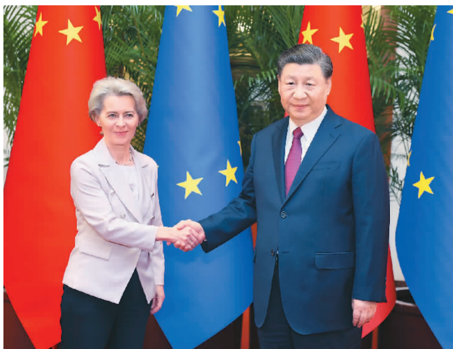
4月6日下午, 国家主席习近平在北京人民大会堂会见欧盟委员会主席冯德莱恩。