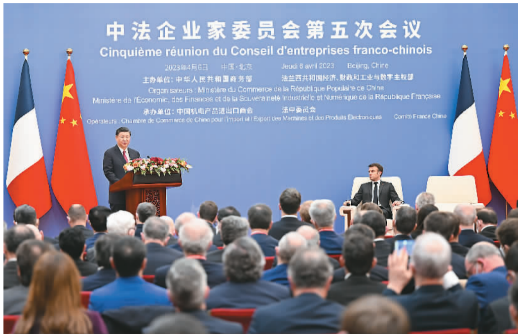
四月六日下午, 国家主席习近平在北京同法国总统马克龙共同出席中法企业家委员会第五次会议闭幕式并致辞。