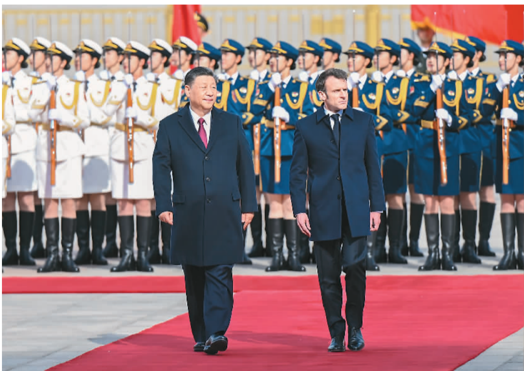
四月六日下午, 国家主席习近平在北京人民大会堂同来华进行国事访问的法国总统马克龙举行会谈。这是会谈前, 习近平在人民大会堂东门外广场为马克龙举行欢迎仪式。