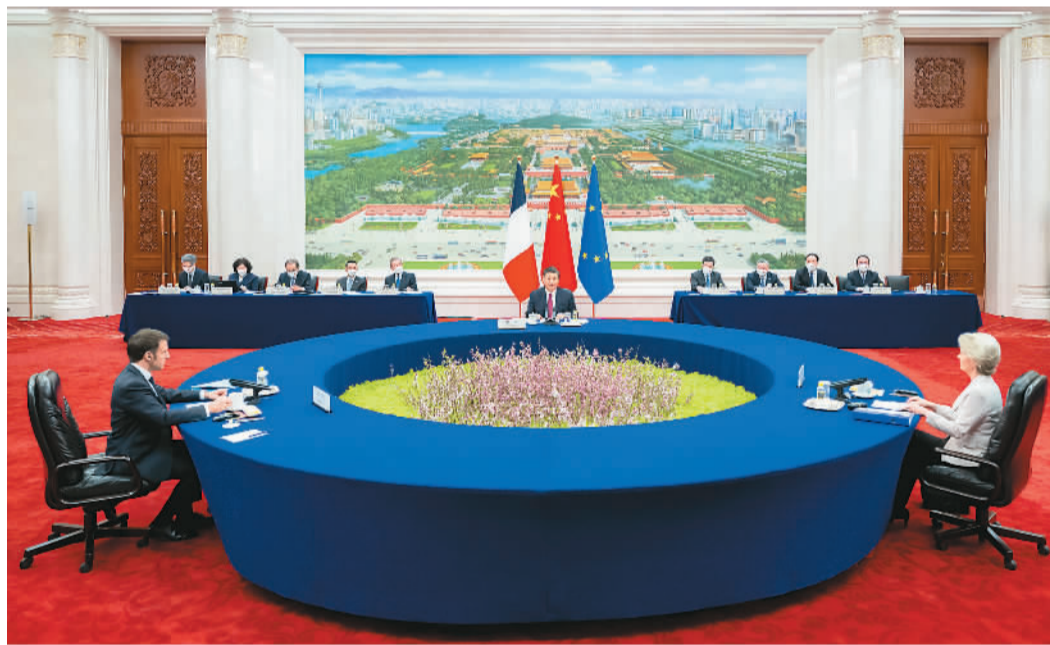
四月六日下午, 国家主席习近平在北京人民大会堂同法国总统马克龙、欧盟委员会主席冯德莱恩举行中法欧三方会晤。