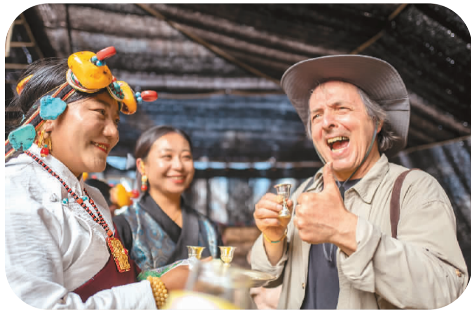
青海省玉树藏族自治州杂多县查旦乡,外国游客品尝当地特色美食。