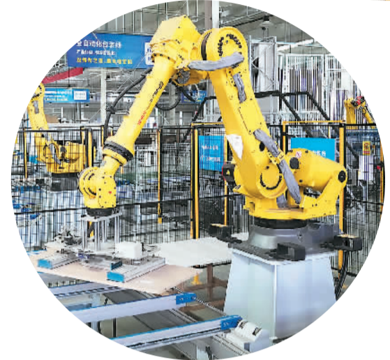
▲从北京转移到 河北省唐山市芦台 经济开发区的某家具 企业，机器手正工作。

3月31日，北京城市副中心，塔吊林立、烟花飞舞，亚洲最大地下综合交通枢纽——副中心站综合交通枢纽施工正酣。