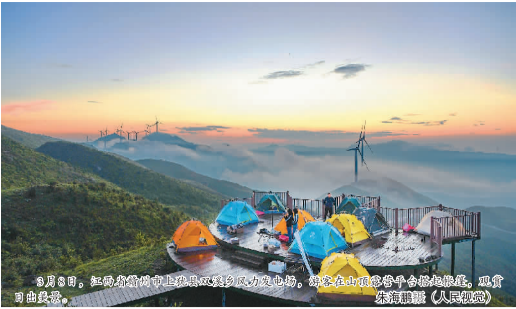
3月8日，江西省赣州市上犹县双溪乡风力发电场，游客在山顶露营地搭起帐篷，观赏日出美景。

缤纷市集点燃城市“烟火气”、精致餐饮俘获食客的心、周末出游的新玩法让微度假流行……今年以来，中国消费市场回暖势头明显，其中餐饮、文娱等服务业表现亮眼。许多突出新意、打造场景、提升体验的消费新业态、新场景，不仅刺激消费活力持续释放，也拉动经济增长，满足人们对美好生活的向往。