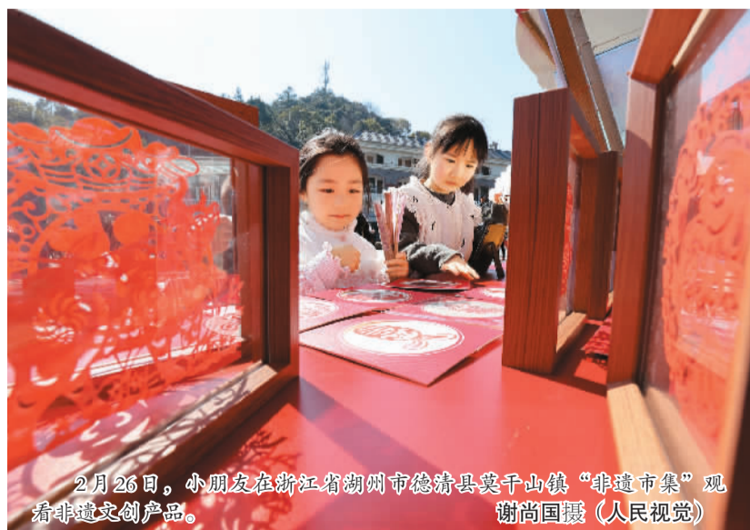
2月26日，小朋友在浙江省湖州市德清县莫干山镇“非遗市集”观看非遗文创产品。