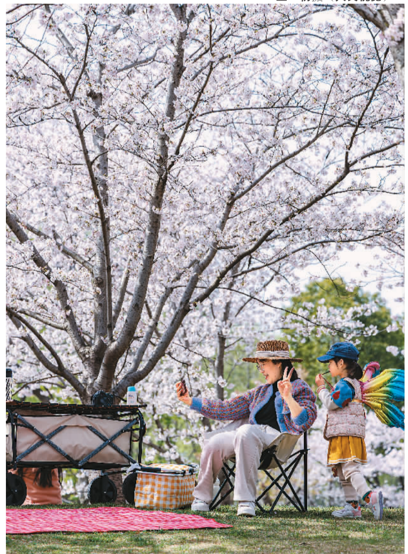
▼3月26日，上海市顾村公园，游人在樱花树下露营休闲。