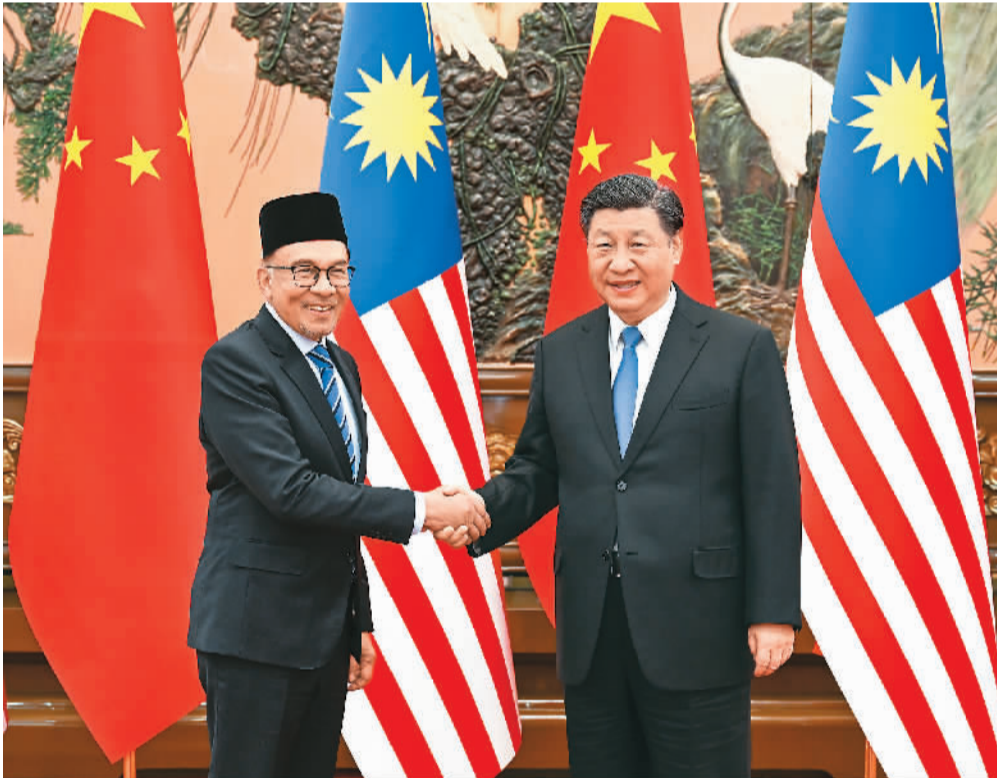
3月31日下午,国家主席习近平在北京人民大会堂会见来华进行正式访问的马来西亚总理安瓦尔。

新华社北京3月31日电 (记者郑明达) 3月31日下午,国家主席习近平在人民大会堂会见来华进行正式访问的马来西亚总理安瓦尔。