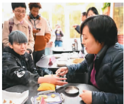
上海市中医医院的医护团队为留学生带来了艾灸等常见的中医疗法。

近年来，同济大学致力于创新留学生面向世界讲好中国故事的能力培养路径，通过“熊猫叨叨——国际学生讲中国故事”“同济大学留学生行走看中国”“留学生中国生态文明体验区”等，帮助留学生亲身感受真实、立体、全面的中国，深入感悟中华文化。