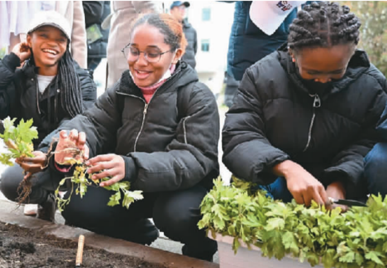
同济大学的留学生们一起种下中草药，零距离感受中医文化的奇妙之处。

蹲在苗圃边，用小铲子先松松土，挖出个小坑，再把一株艾草幼苗小心翼翼地种入土中，最后覆盖上泥土。这是在同济大学南校区一块小园圃里，来自55个国家的百余名留学生们一起种下艾草、杜仲等中草药的画面。留学生们通过种中草药，零距离感受中医文化的奇妙之处。