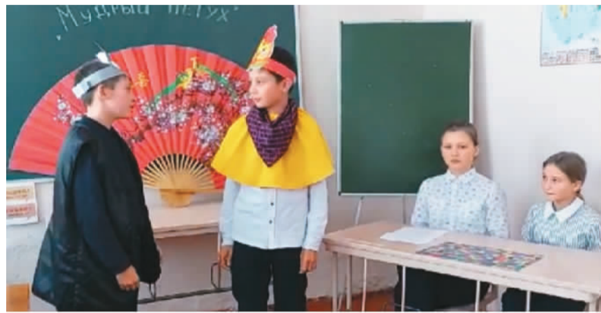
1年来，共有300名俄罗斯学生参加俄罗斯青少年中文空中课堂首期课程。图为俄罗斯学生在课堂中。