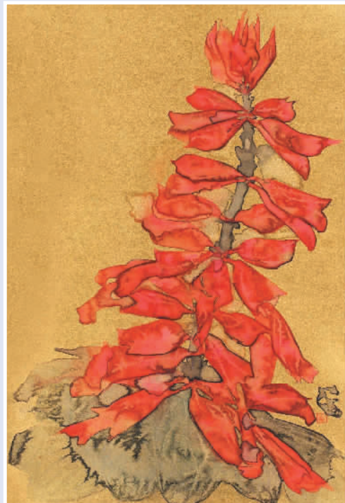
▲ 红色 (中国画)