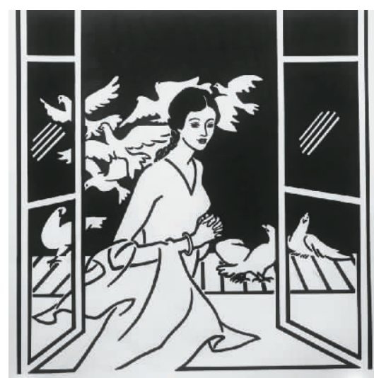
▲ 重逢“明姑娘” (水墨) 金城 (《读者》2020年第10期)