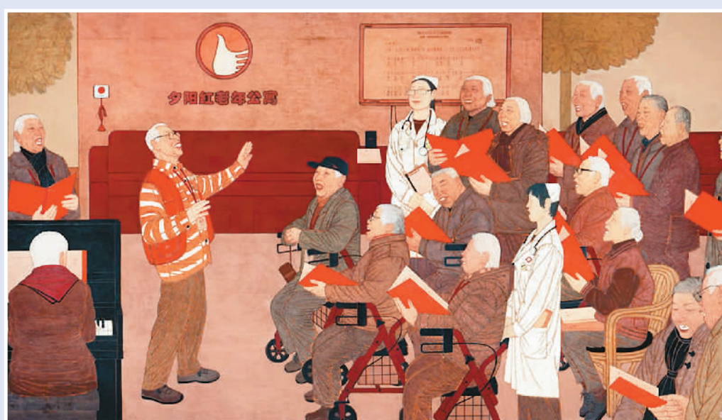
▲ 夕阳欢歌 (中国画)

对传统技法的赓续、对时代精神的领悟，铺就了当代中国画作品的底色。当然也存在不足之处，比如一些主题雷同、有些画面“照片化”、呈现形式相对单一等。期待在新时代的实践中，艺术家们能够以创新创造攀登艺术高峰，让古老的中国画焕发时代光彩，绘写丹青画卷的多彩篇章。