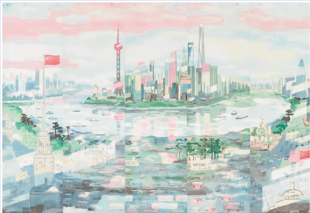
▲ 浦东清晨意象图 (中国画)