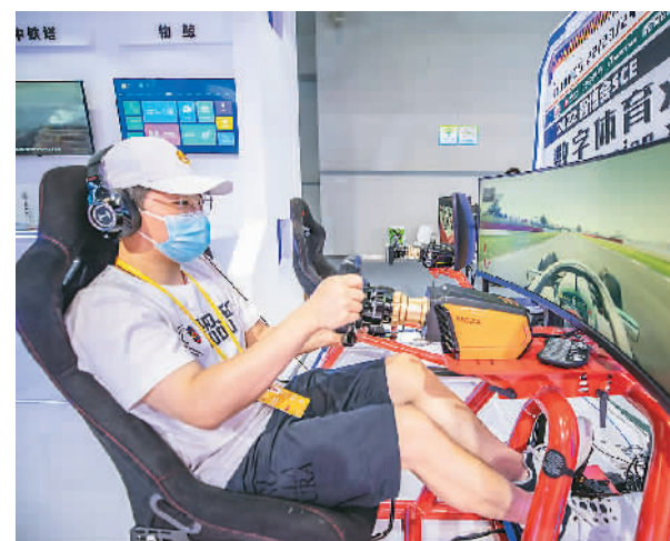
工作人员在演示F1电竞模拟器。