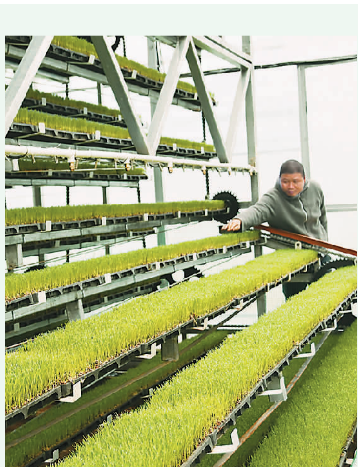
春耕时节，湖南省永州市江永县潇浦镇接龙桥村谷湘现代农业专业合作社多功能“智慧育秧工厂”投入使用，在实现集中规模化育秧的同时能够控光、控温、控湿和操作自动化等，有效避开“倒春寒”的风险，提高育秧效率和秧苗成活率，提升水稻产量。图为在该育秧工厂，农民正查看早稻秧苗生长情况。

市场监管总局将加强对各地市场监管部门的业务培训，做好对互联网平台企业及相关广告经营主体的行政指导，有效提升互联网广告监管能力和行业发展水平，增强各类广告经营主体依法合规经营意识，以高效能监管促进互联网广告业高质量发展。