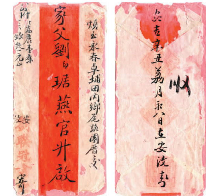
一九〇一年，通过“水客”由印度尼西亚安汶寄往福建永春的信。

“印尼侨批浓缩了先辈们深厚的家国情怀和坚韧的奋斗精神。”论坛期间，印尼华文作家协会总主席袁霓对本报记者说，为了给家人创造美好生活，先辈们漂洋过海来到印尼。他们不畏艰辛，踏实勤恳，把辛苦攒下的钱随同家信寄回家乡，为当时的中国送去重要的侨汇。印尼6000多个有人居住的海岛，大部分都留有华侨华人奋斗的足迹。福建、广东、海南等各地，也都流传着先辈们闯南洋、报桑梓的故事。