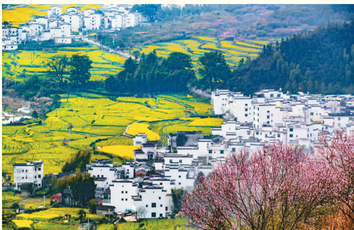
上图：江西省上饶市婺源县油菜花绽放。 左下图：安徽省黄山市歙县石潭村，云雾缥缈，风景如画，游人如织。 右下图：安徽省芜湖市繁昌区孙村镇中分村出现平流雾景观。