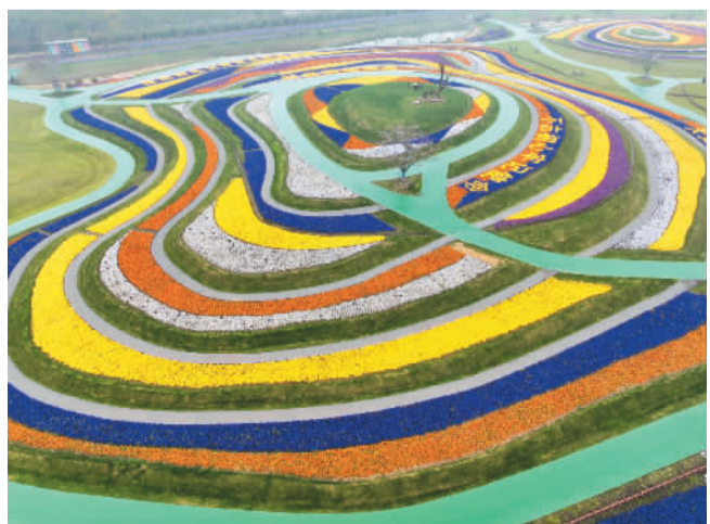
江苏省南通市重点文旅项目洲际梦幻岛美丽景色。

中华大地色彩缤纷，好似彩虹散落人间。唯愿此去经年，时光不弃，踏遍千山万水，共赏大地韶光。