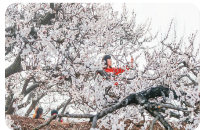
相山区黄里村杏花绽放。

近年来，相山区借势“新春第一游”的杏花节，不断发展踏青赏花游、美丽乡村游、民俗体验游，深入推动农旅融合发展，依托特色产业，推进生态农业、观光农业、特色工业发展，逐步形成各产业联动的发展格局。该区通过建立“旅游区+观光、采摘园+企业+农户”的联动模式，促进了现代农业和旅游业的结合，实现了传统农业向现代观光休闲农业转型发展的新突破。国家地理标志产品黄里色斗杏也因活动走进大众视野。