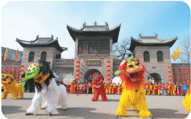
大阳古镇为游客推出系列民俗社火表演。

大阳镇还将民间文化艺术送进校园、社区、乡村，年均送文化艺术下乡活动22场，受益群众近5万人次。当地以20位村级文化管理员为抓手，6个重点村为主体，成立6支文艺小分队，结