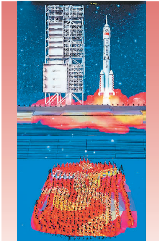
▲《伟大征程——庆祝中国共产党成立100周年大型情景史诗》中的节目《行进的火炬》

当代文艺工作者正以更饱满的精神、更绚烂的笔墨、更充沛的创造力，高举时代精神灯火，吹响人民前进号角，在中华民族伟大复兴的历史伟业中，努力铸就新时代文艺高峰。