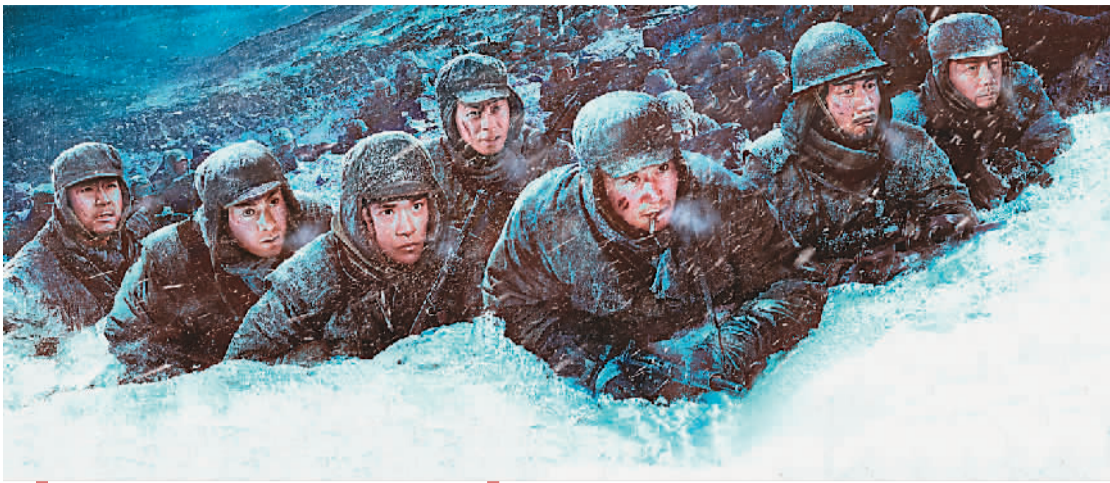
▲电影《长津湖》海报 (资料图片)