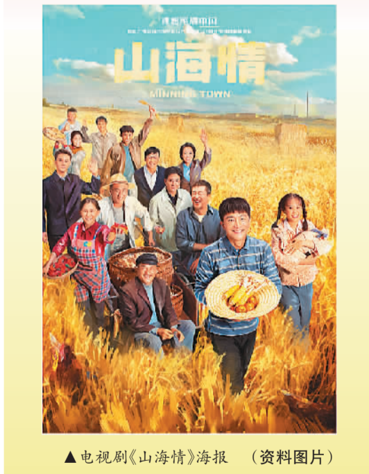
▲电视剧《山海情》海报 (资料图片)

142亩土地上播种、灌溉、施肥、收获。节目借鉴“慢综艺”的制作方法，将综艺和劳动、劳作相结合，在劳作中展现乡村之美，诠释“藏粮于地、藏粮于技”的现实内涵。《山水间的家》采取纪录片的拍摄手法，精心选取了在文旅融合发展层面具有代表性的24个特色乡村，以平易而亲和的“探访”视角与当地村民进行深入交流，通过一个个有温度、接地气的人物故事，折射出中国农村在乡村振兴政策背景下收获的喜人成果。