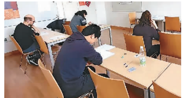
日前，奥地利维也纳大学孔子学院顺利举办2023年首场汉语水平考试，考生们参加了一级到六级的汉语水平考试以及汉语水平口语考试（初级）。图为考试现场。