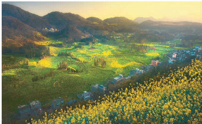
罗平牛街螺丝田油菜花。

曾经的“迷易八景”模糊了，但今天的米易，在全面实施乡村振兴战略和全面建设社会主义现代化国家的新征程中，在全县22万各族儿女的努力下，创造出更多更美的风光：别致靓丽的时尚县城，休闲舒适的康养庭院，山花烂漫的海塔、普威，神奇美丽的颛顼龙洞，整洁优雅的旅游新村等等，米易如此众多的美景，早已名声在外，吸引着全国各地的游人纷纷慕名而去。这些美轮美奂的新时代美景，已无法用“八景”去归纳了。